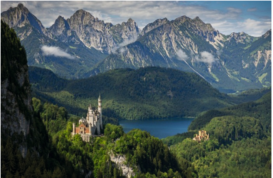
Abbildung 5: Allgäu GmbH-Gesellschaft für Standort & Tourismus/Bespieldestination für Lebensraumperspektive in Deutschland

Die Entwicklung ist kein Sprint, sondern ein längerer Prozess. Sie benötigt Begegnung auf Augenhöhe, Geduld und Konsequenz – in jedem Fall erfordert dieser Wandel jedoch auch die politische Anerkennung, entsprechende Ressourcen und eine langfristige Finanzierung.