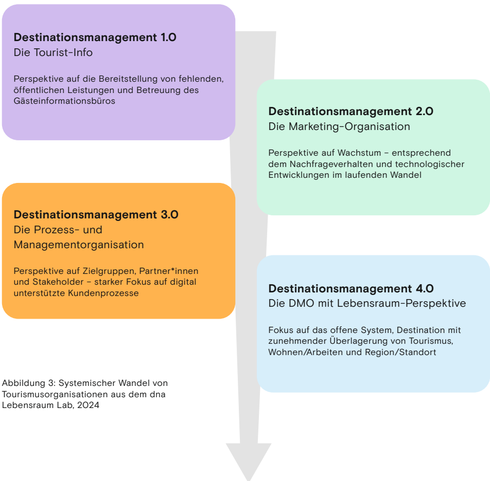
Abbildung 3: Systemischer Wandel von Tourismusorganisationen aus dem dna Lebensraum Lab, 2024

Wir unterscheiden insgesamt 4 Stufen des Wandels von Tourismus-Organisationen/ abhängig vom jeweiligen Reifegrad der Destination.