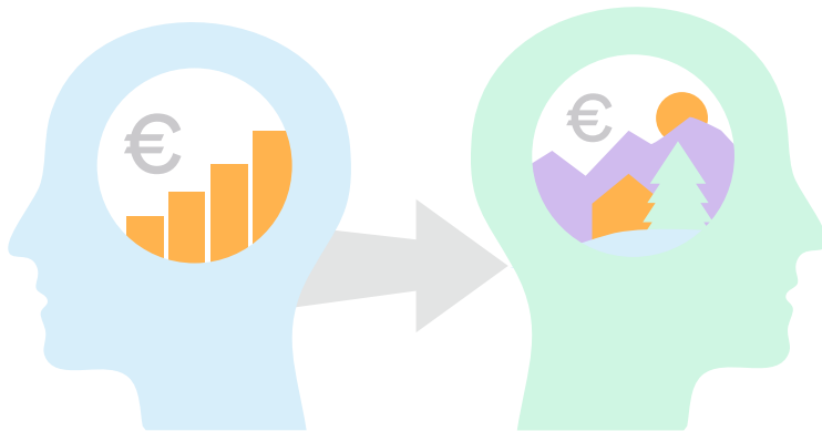
Abbildung 2: Die Ausweitung des Blickwinkels, dna Lebensraum Lab, 2025

Es braucht also diese Lebensraumperspektive im Tourismus, um auch Aufmerksamkeit auf die sozialen & ökologischen Themen in der Destination zu legen.