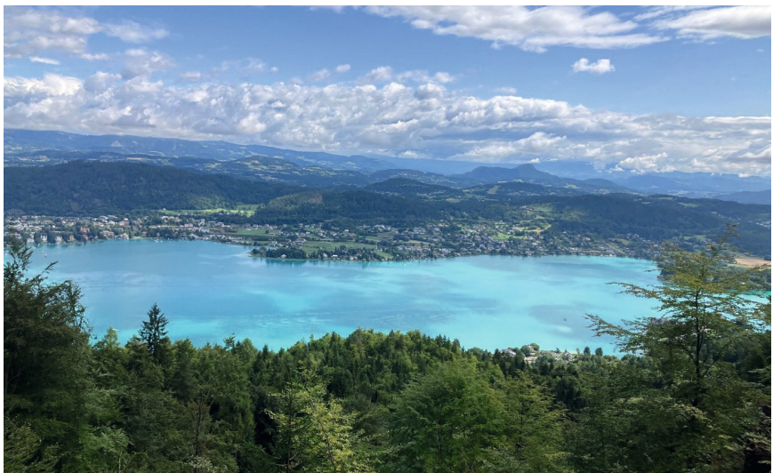
Abbildung 1: Wörthersee - Die Natur als unser Mitgestalter

Im Lebensraum Lab arbeiteten in den vergangenen knapp zwei Jahren insgesamt 17 Expert*innen aus 10 Destinationen (Montafon Tourismus GmbH, Tourismusverband Wilder Kaiser, Tourismusverband Inneres Salzkammergut, Tourismusverband Schladming-Dachstein, Saalfelden Leogang Touristik GmbH, Ötztal Tourismus, Millstätter See - Bad Kleinkirchheim - Nockberge Tourismusmanagement GmbH, NLW Tourismus Marketing GmbH, Wagrain-Kleinarl Tourismus, Kleinwalsertal Tourismus eGen), die durch Destinations-Netzwerk Austria angesprochen/ausgewählt wurden (Geschäftsführer*innen und/oder Nachhaltigkeitsmanager*innen), dazu Vertreter*innen der Österreich Werbung und des Bundes/BMWET-Sektion Tourismus.